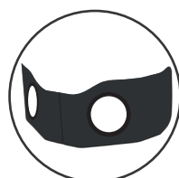
PORTELLO CON PASSAMANI